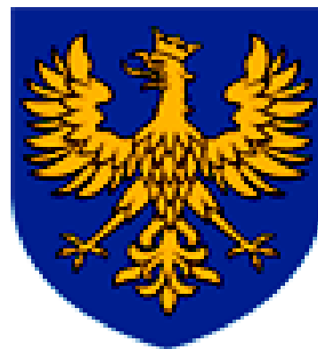
HERB KSIĄŻĄT OPOLSKICH